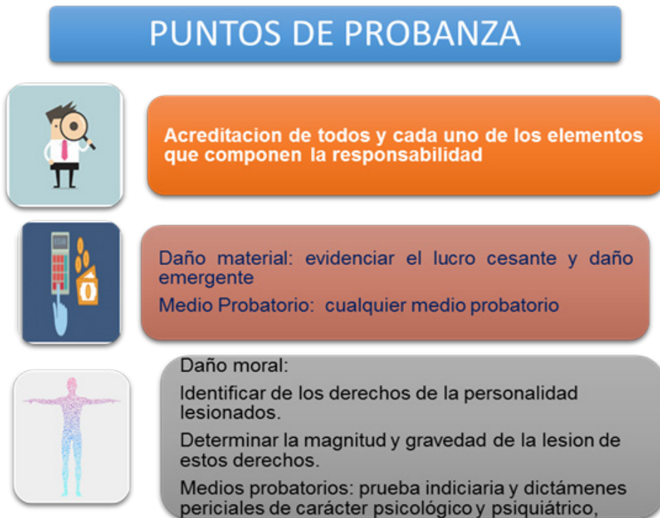
Figura 4. Puntos de probanza del daño moral.