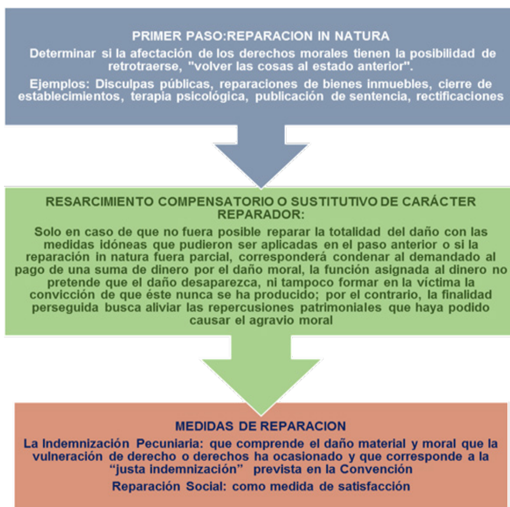
Figura 2. Proceso de reparación del daño moral.

Consiste en restablecer la situación de la víctima al momento anterior al hecho ilícito, anulando las consecuencias de dicho acto u omisión ilícitos. Esta restitución a las condiciones anteriores implica dejar sin efecto las consecuencias inmediatas del hecho, en todo aquello que sea posible, y en indemnizar a título compensatorio los perjuicios causados, ya sean estos de carácter patrimonial o extra patrimonial (Corte IDH, Caso Velásquez Rodríguez, Sentencia de Reparaciones, párrafo 38).